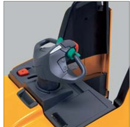
Komfortabel gestalteter Arbeitsplatz