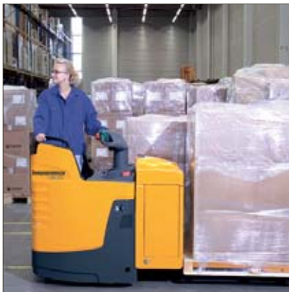
Fahrt in Antriebsrichtung mit dem ERE 225